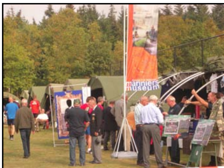
Veel gezelligheid en inspanning.....