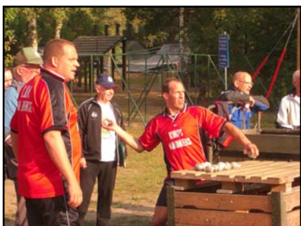
Instructies en tactisch oeverleg.....