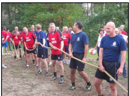
Het onverslaanbare touwtrekteam van Groningen-Drenthe!