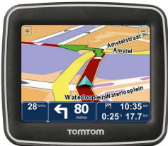
Tom Tom Start 2

Lotenverkoop met mooie prijzen! € 5,- per 10 loten!