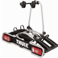
Thule Euroway 45 (2 fietsen)